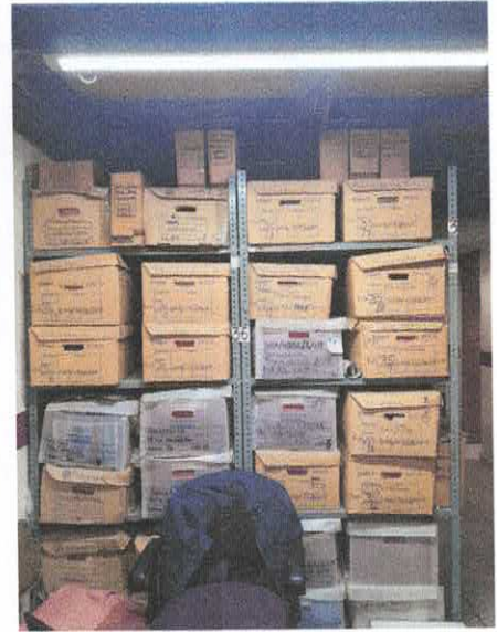
Fotografías del Edificio de Polígonos (Calle Cazadora 702)