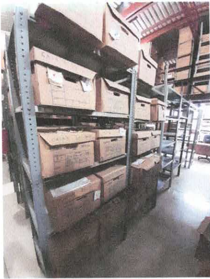
Fotografías del Archivo de Concentración (Calle Sindicatos 106)