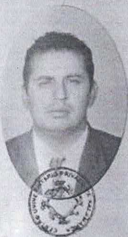
Firma del Alumno

CENTRO UNIVERSITARIO PRIVADO DE SALAMANCA