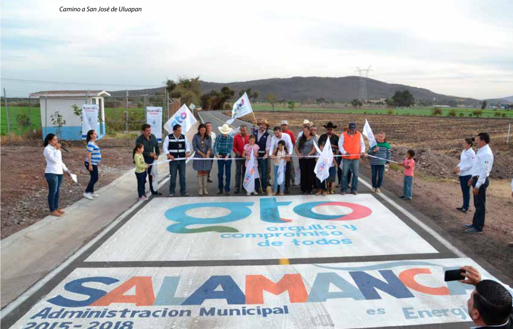
Camino a San José de Uluapan