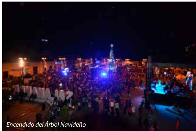
Encendido del Árbol Navideño