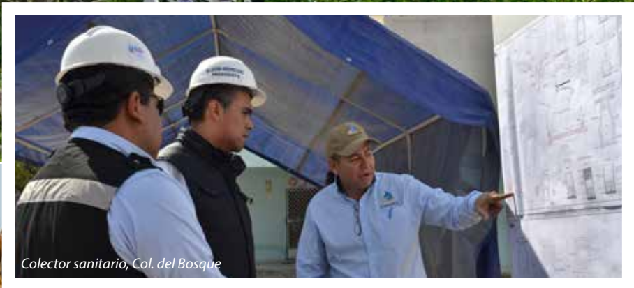
Colector sanitario, Col. del Bosque