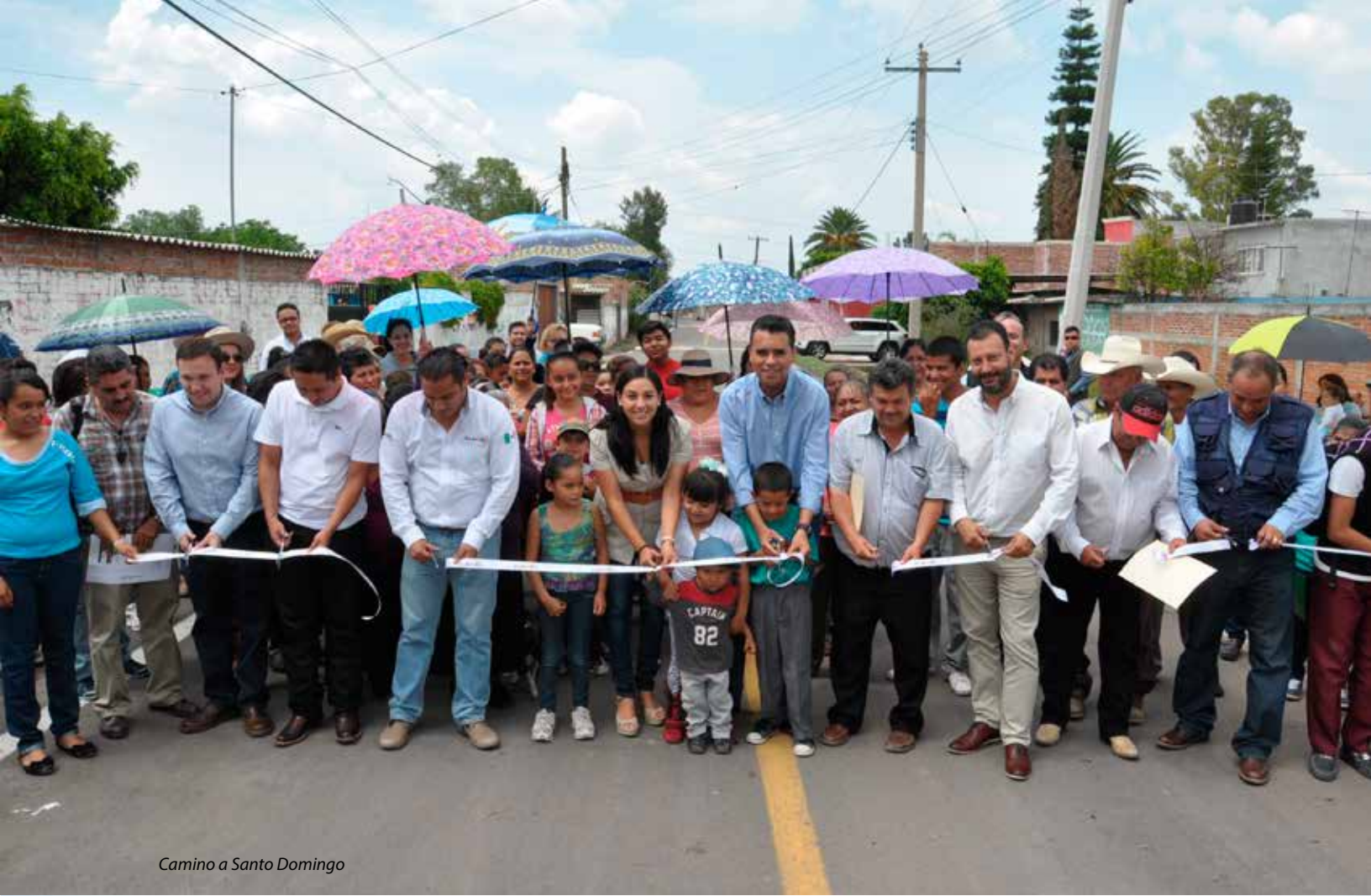
Camino a Santo Domingo