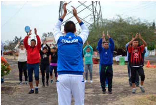
Vía Energízate, Blvd. San Pedro