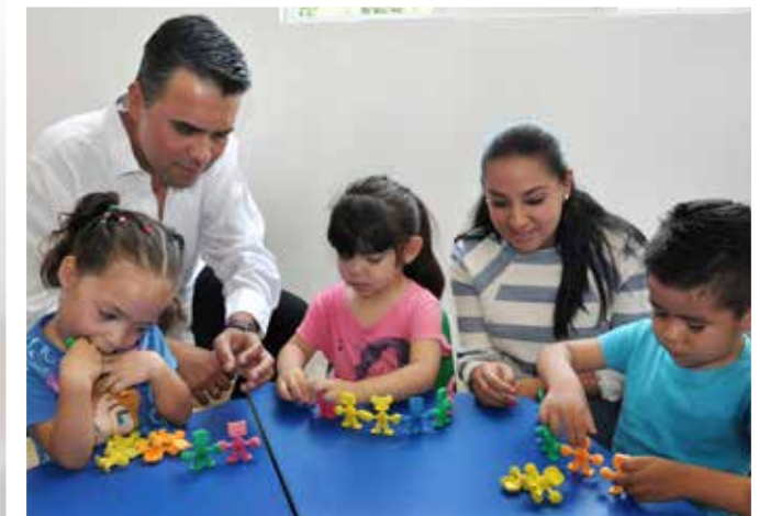
Inauguración ampliación CADI Col. Guanajuato

Trabajamos por las niñas y los niños de Salamanca, para que sus padres de familia tengan la seguridad de que se encuentran bien cuidados y protegidos mientras ellos trabajan.