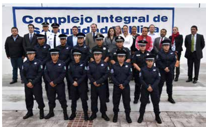
Graduación Generación XIX de la Academia