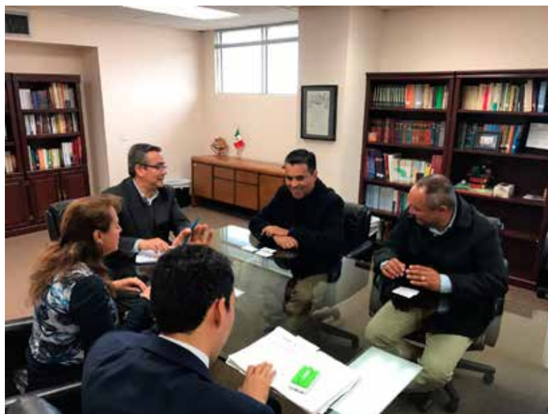
Consulado de México en Houston, Texas.