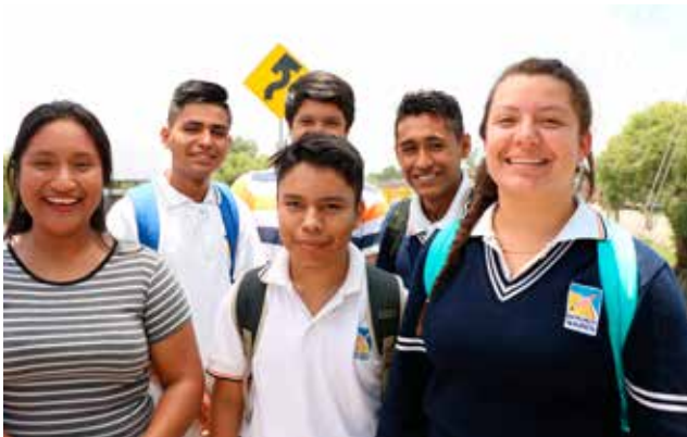
Acto Cívico Escuela Independencia de México, Col. 18 de Marzo

En Coordinación con la Secretaría de Innovación, Ciencia y Educación Superior del Gobierno del Estado y el Centro Mexicano de Energías Renovables CEMER, impulsamos el Programa de Reducción de Brecha Digital, con el cual beneficiamos a 1,300 alumnos del nivel básico, media superior y superior, de 13 comunidades de Salamanca con esquemas de divulgación de la ciencia y la tecnología para promover una cultura científica desde edades tempranas mediante el uso de las TIC. En esta acción apoyamos 1 millón 500 mil pesos de recurso municipal.