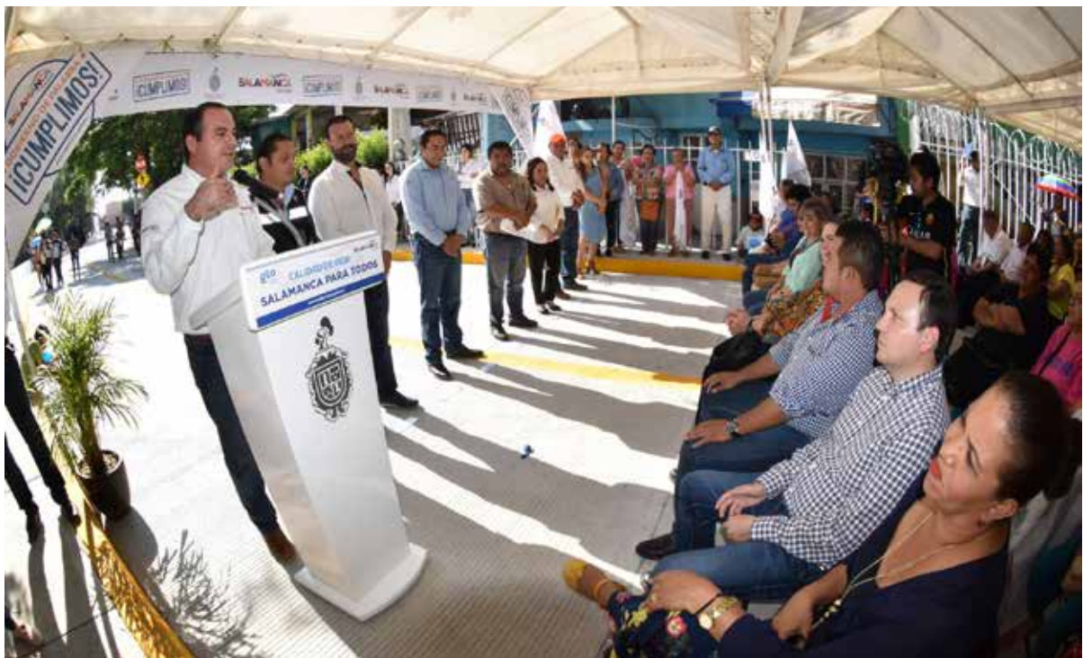
Inauguración Calle Paseo Río Lerma