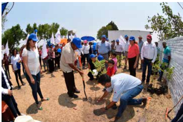
Programa Juntos Somos Energía Com. Perico de Razos

Con el programa Juntos Somos Energía se han realizado 173 acciones entre las que destacan la atención de alumbrado público, pintura, manteniendo en áreas verdes, limpieza de áreas y alcantarillado, para apoyar un total de 2,200 habitantes repartidos en las comunidades de El Coecillo, 4 de Altamira, Colonia Morelos, Perico de Razos Comunal, San José de la Montaña, Hacienda del Carmen, Com. Zapote de Palomas, Col. Nativitas.