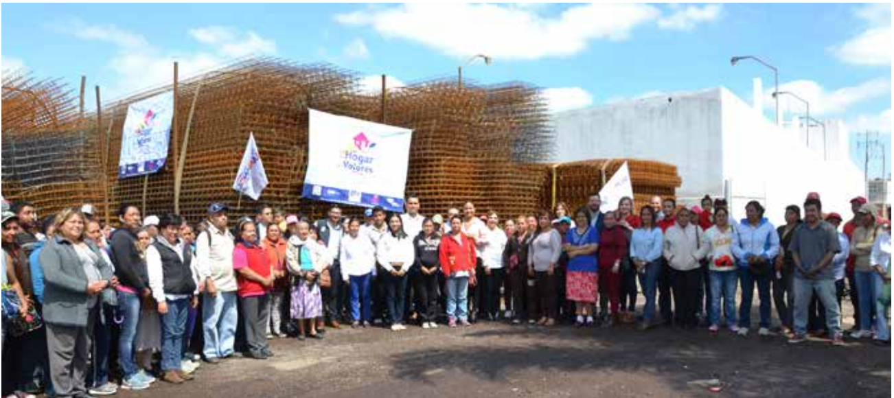
Arranque del Programa "Mi Casa Diferente"