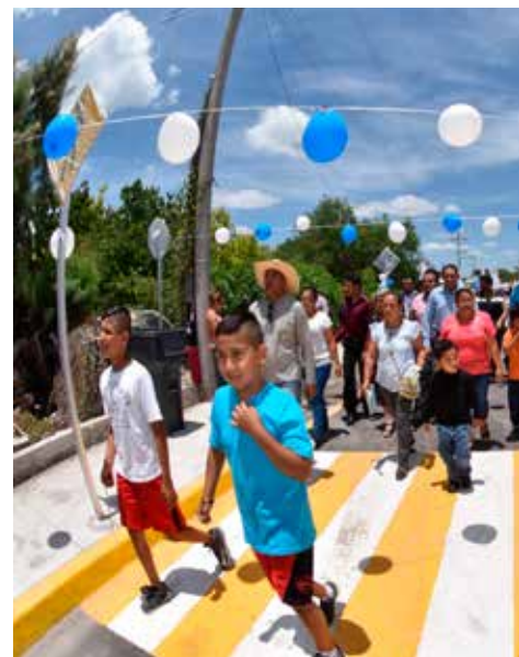
Calle Praderas del Sol, Comunidad de Sotelo