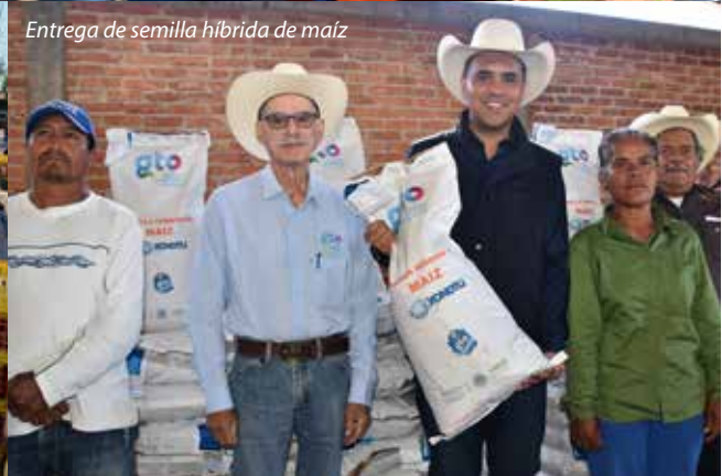
Entrega de semilla híbrida de maíz