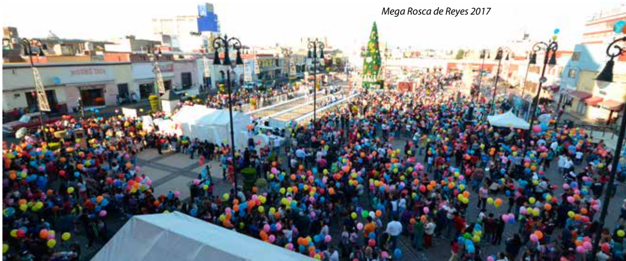
Mega Rosca de Reyes 2017