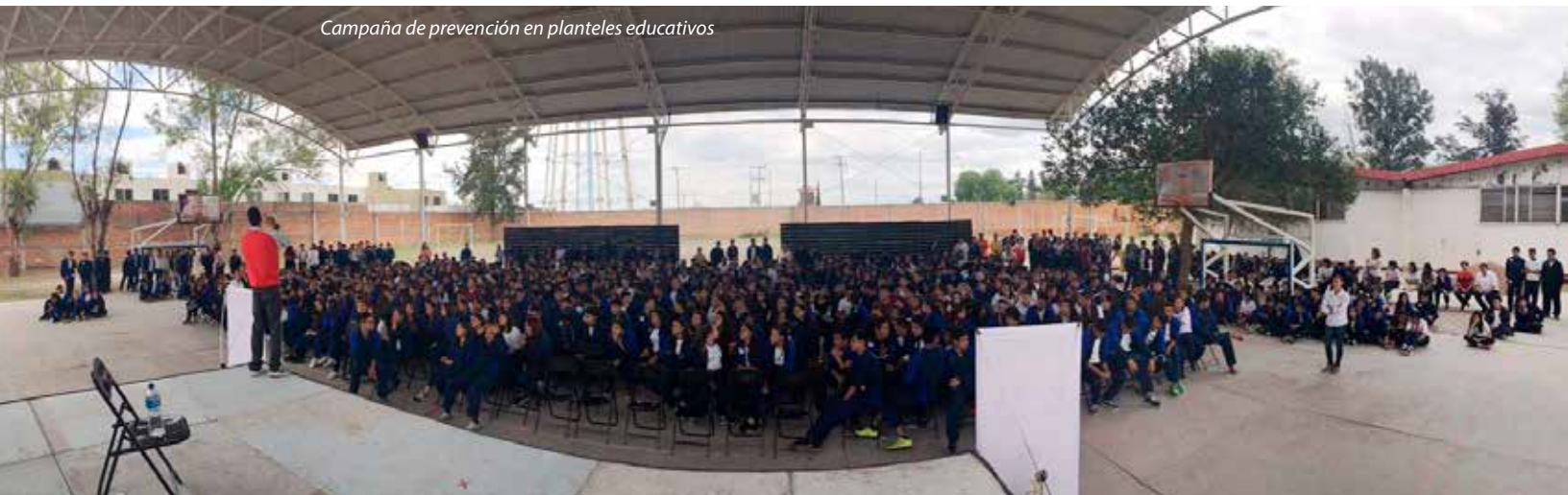
Campaña de prevención en planteles educativos

Realizamos una campaña de Canje de Arma para evitar accidentes en el hogar, contribuir a la economía familiar coadyuvar a mantener la seguridad, tranquilidad y paz social en el municipio.