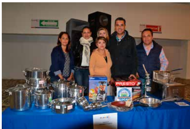
Entrega de equipamiento Programa Impulso en Energía