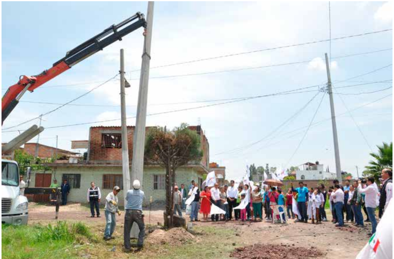
Ampliación de línea eléctrica, Col. Ampl. El Rosario