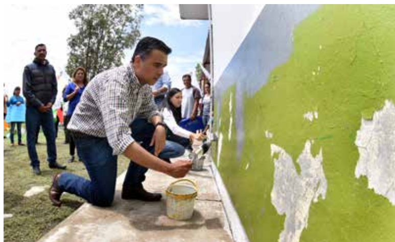
Programa Juntos Somos Energía Com. Haciendita del Carmen