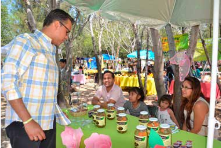
Recorrido Ecoparque Fest 2017

Con el objetivo de fortalecer el comercio justo, local y sustentable existente en Salamanca y sus comunidades, organizamos el 3er. Ecoparque Fest, logrando posicionar este evento a nivel regional, contando con la presencia de 3,800 visitantes, creando un foro importante para los más de 150 expositores y artistas que se dan cita año con año; a este evento se suma también "Vochomania" siendo sede también el Ecoparque Salamanca, creando una vez más espacios y eventos para el esparcimiento y recreación de las familias Salmantinas.