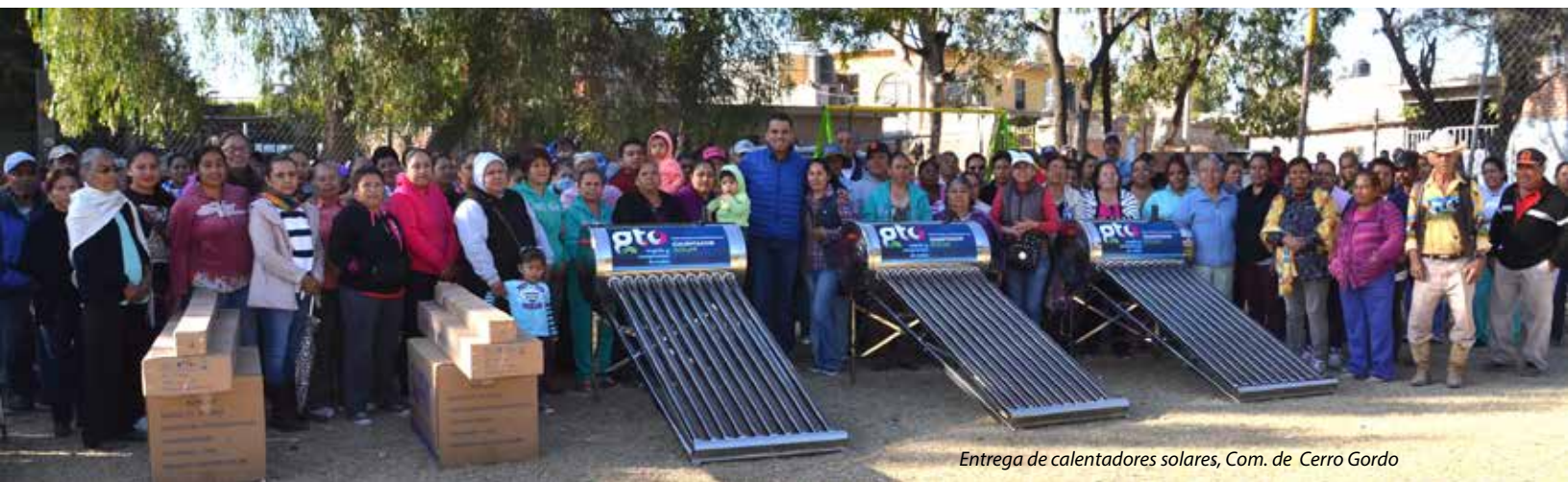
Entrega de calentadores solares, Com. de Cerro Gordo