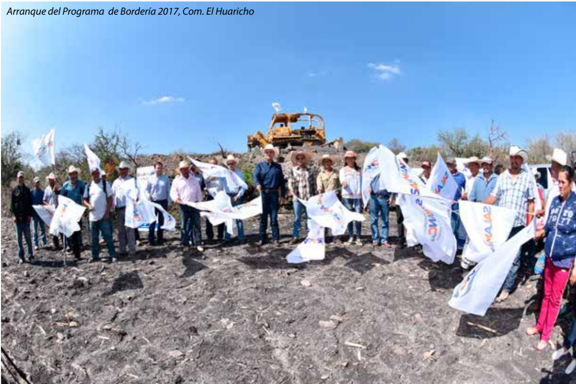
Arranque del Programa de Bordería 2017, Com. El Huaricho

A través del Programa de “Fideicomiso de Bordería de Infraestructura Rural (FIBIR)” Estatal Impulso a la Economía Social Sustentable, realizamos 32 acciones para la construcción de bordos de captación de aguas en zonas específicas en beneficio de 920 habitantes de la zona rural.