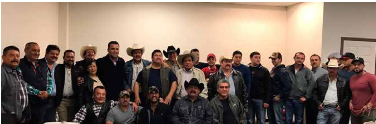
Grupo de migrantes Houston, Texas.