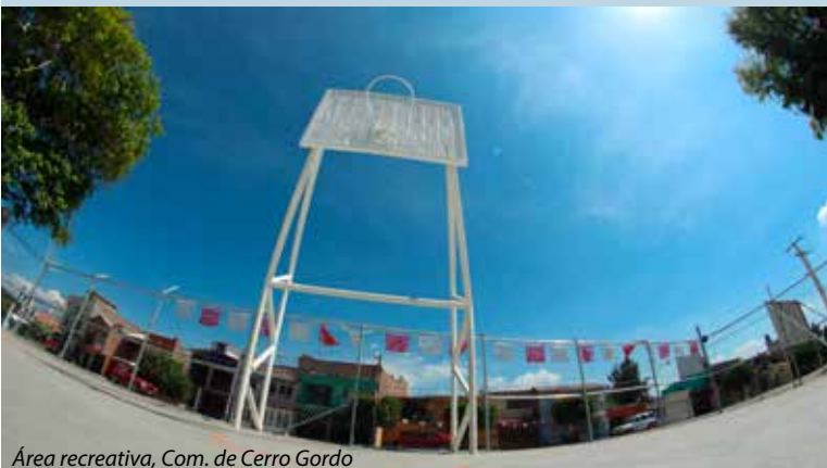
Área recreativa, Com. de Cerro Gordo