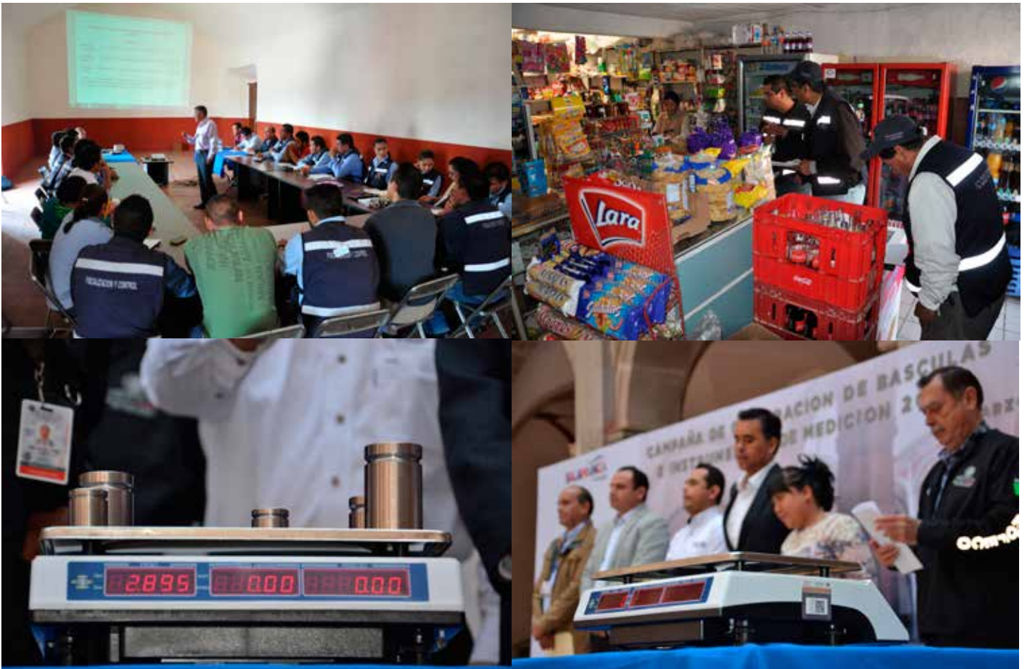
Campaña de calibración de básculas

Participamos en el Programa de Simplificación Administrativa "SIMPLIFICA".