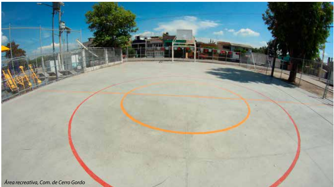
Área recreativa, Com. de Cerro Gordo