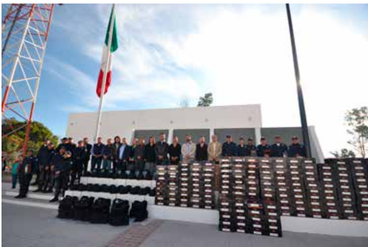
Entrega de equipamiento a Coordinación de Seguridad Pública