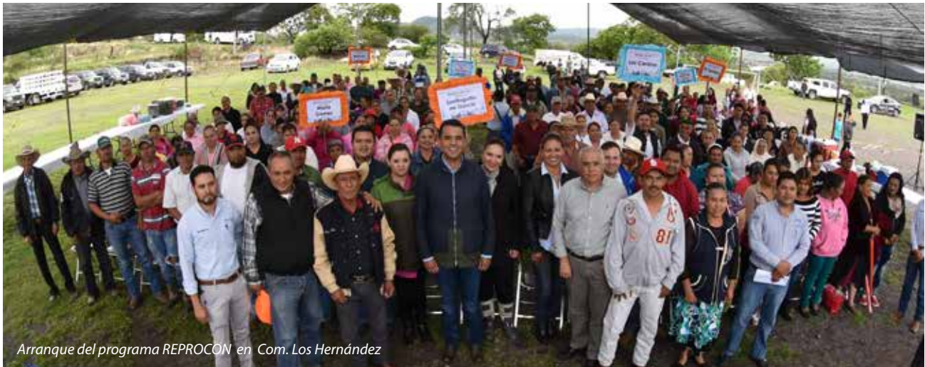
Arranque del programa REPROCON en Com. Los Hernández