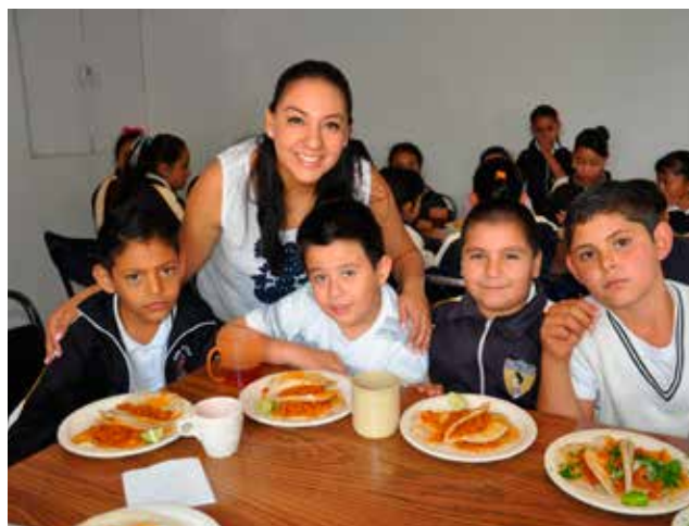
Visita a comedores comunitarios

Brindamos orientación alimentaria a 685 amas de casa, para que tengan más información sobre la importancia de equilibrar los alimentos, con el fin de fomentar hábitos saludables.