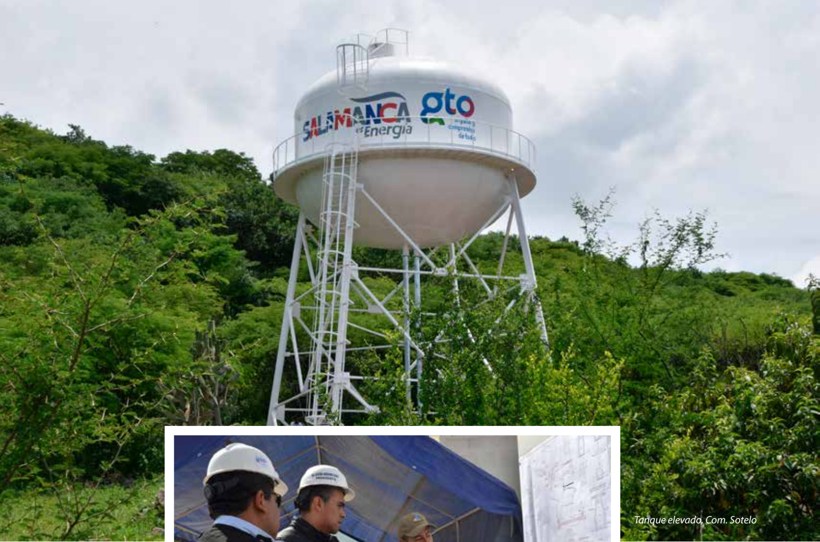
Tanque elevado, Com. Sotelo