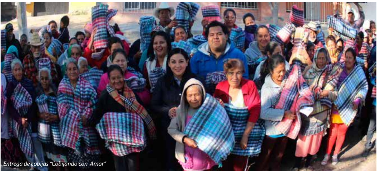
Entrega de cobijas "Cobijando con Amor"