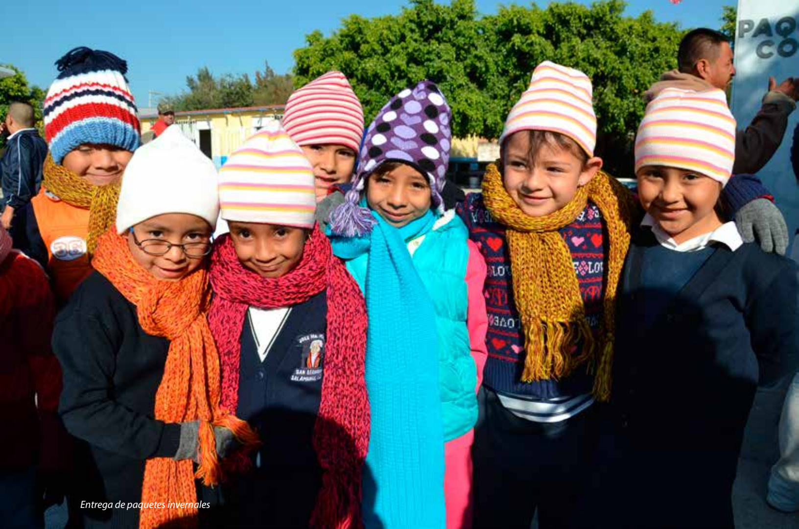
Entrega de paquetes invernales