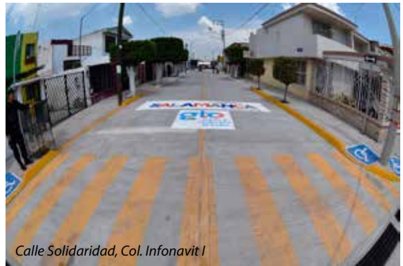
Calle Solidaridad, Col. Infonavit I