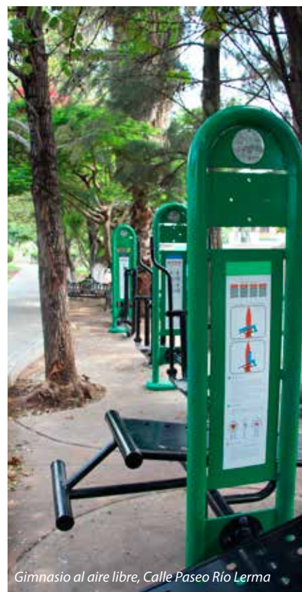
Gimnasio al aire libre, Calle Paseo Río Lerma