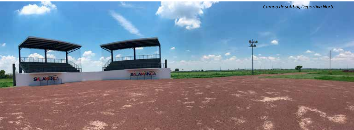
Campo de softbol, Deportiva Norte