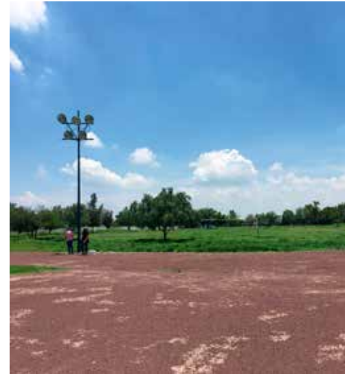
Área recreativa, Col. Las Estancias