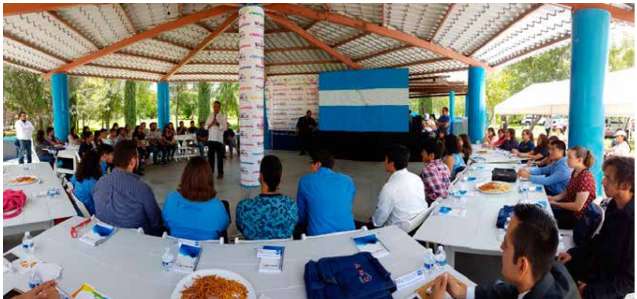
Reunión con Jóvenes Emprendedores en las instalaciones del Ecomarque.

Se llevó a cabo la Reunión con Jóvenes Emprendedores en las instalaciones del Ecomarque, cuyo objetivo fue presentar sus obras y proyectos. Aquí se dieron cita 50 jóvenes con disciplinas dentro del deporte, artes e integrantes de asociaciones civiles.