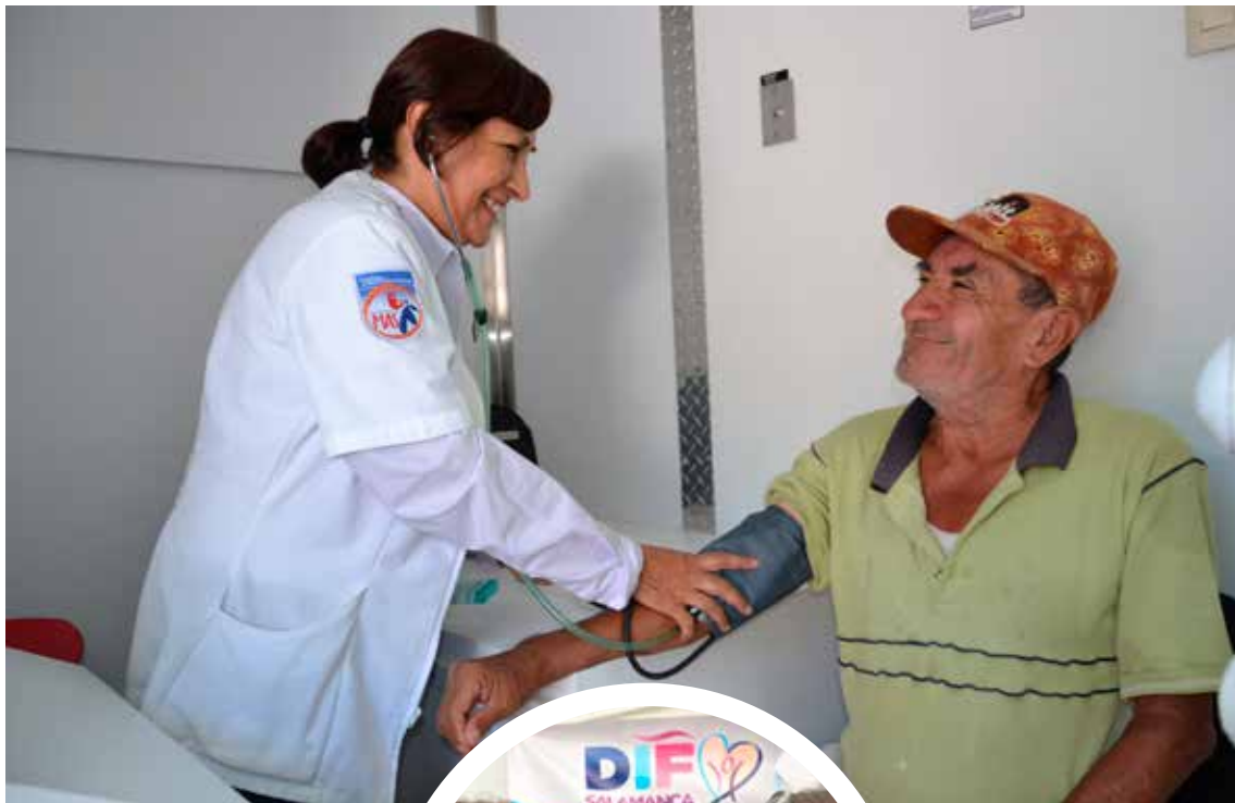
Unidad Médica Móvil DIF