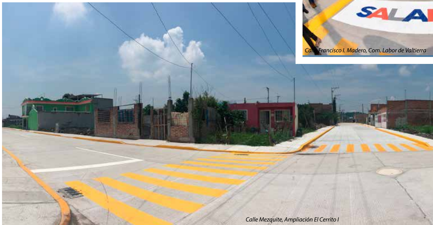
Calle Mezquite, Ampliación El Cerrito I