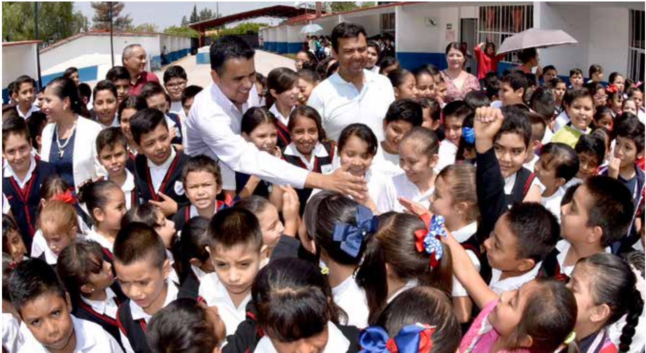
Entrega de apoyo Escuela Andrés Delgado

Realizamos la primer y segunda Jornada Municipal de Trámite de Cédula Profesional, con el objetivo de acercar los servicios que ofrece el Gobierno Estatal en lo referente a la recepción del trámite de cédula profesional en todos los niveles, con la intención de que los egresados titulados que aún no cuenten con este documento puedan realizar su trámite sin necesidad de trasladarse a otro municipio o fuera del Estado de Guanajuato. Al momento llevamos 72 profesionistas beneficiados, producto de la primer jornada y la segunda jornada está en ejecución.