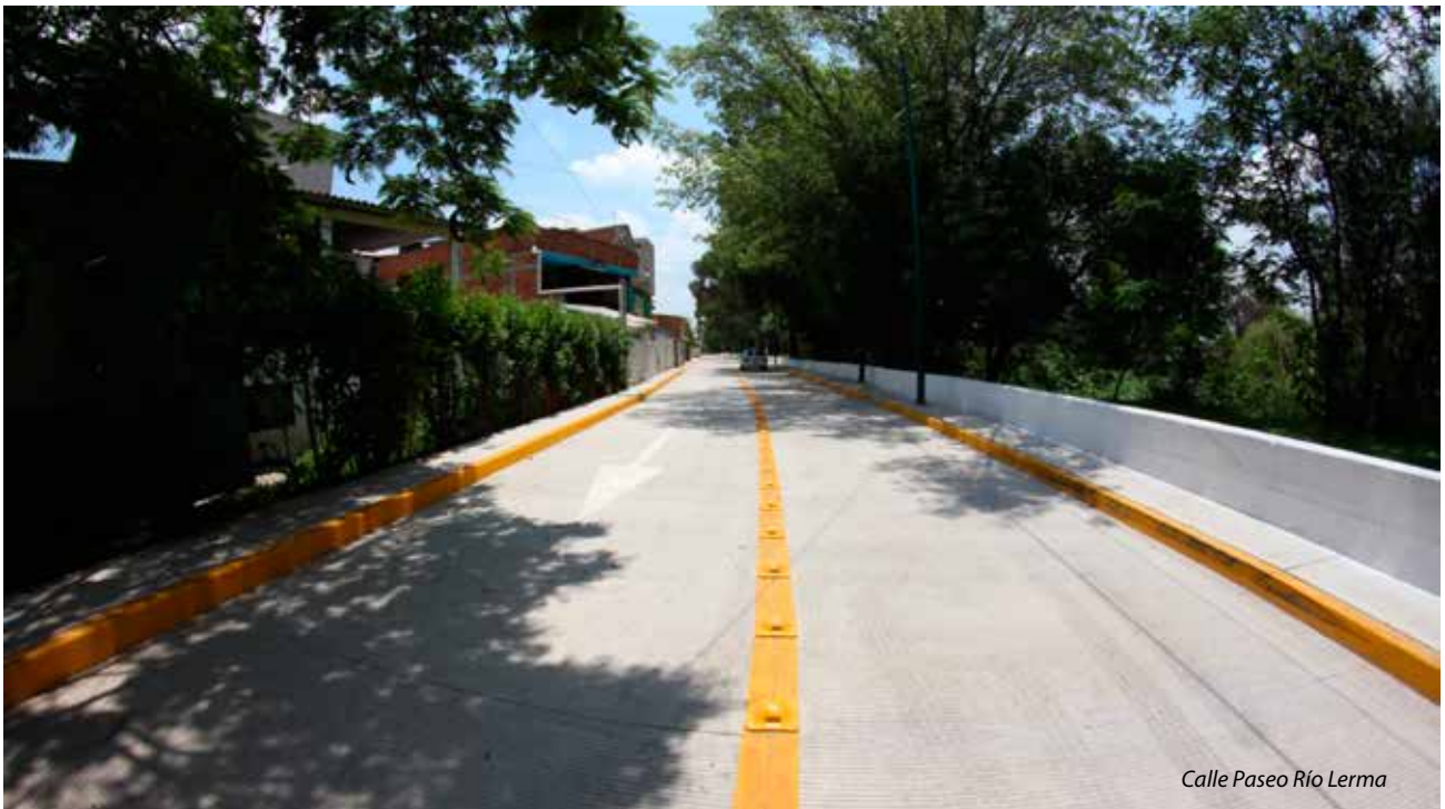
Calle Paseo Río Lerma