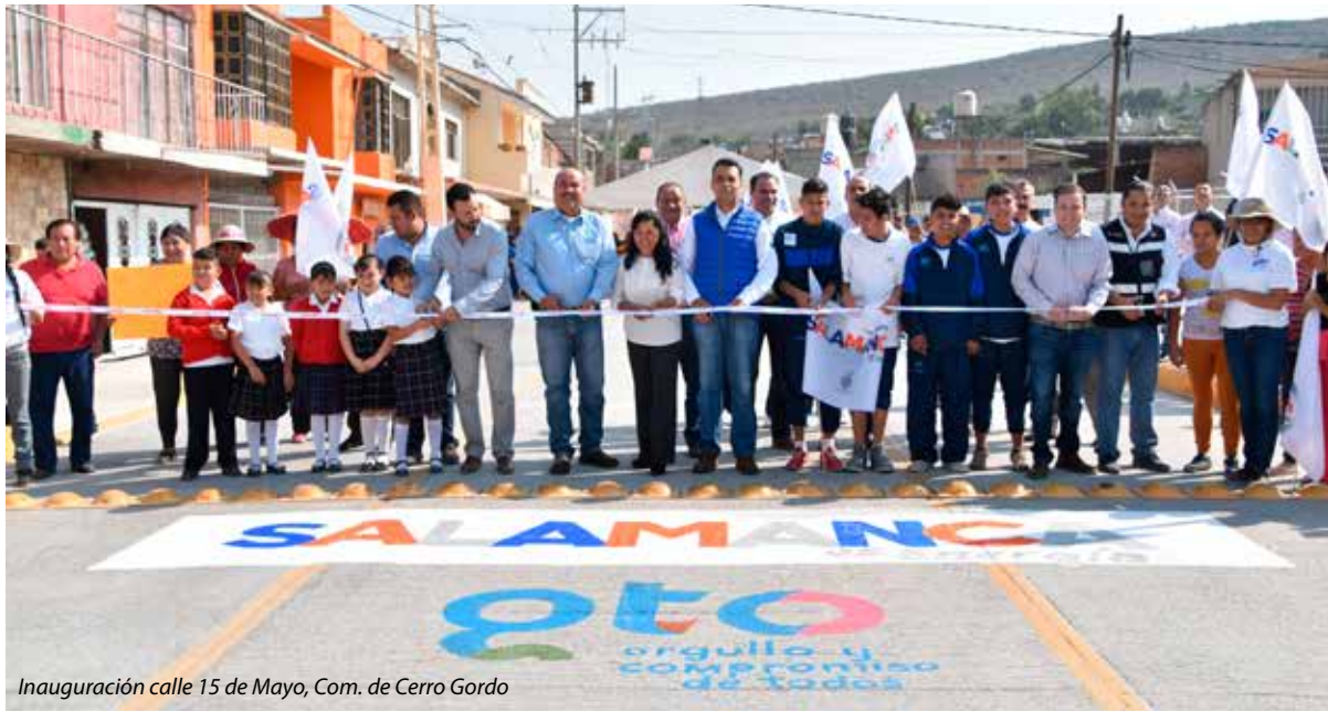
Inauguración calle 15 de Mayo, Com. de Cerro Gordo