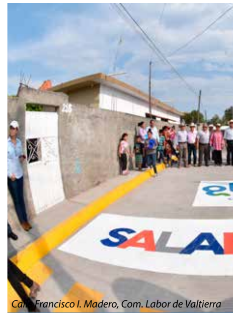
Calle Francisco I. Madero, Com. Labor de Valtierra