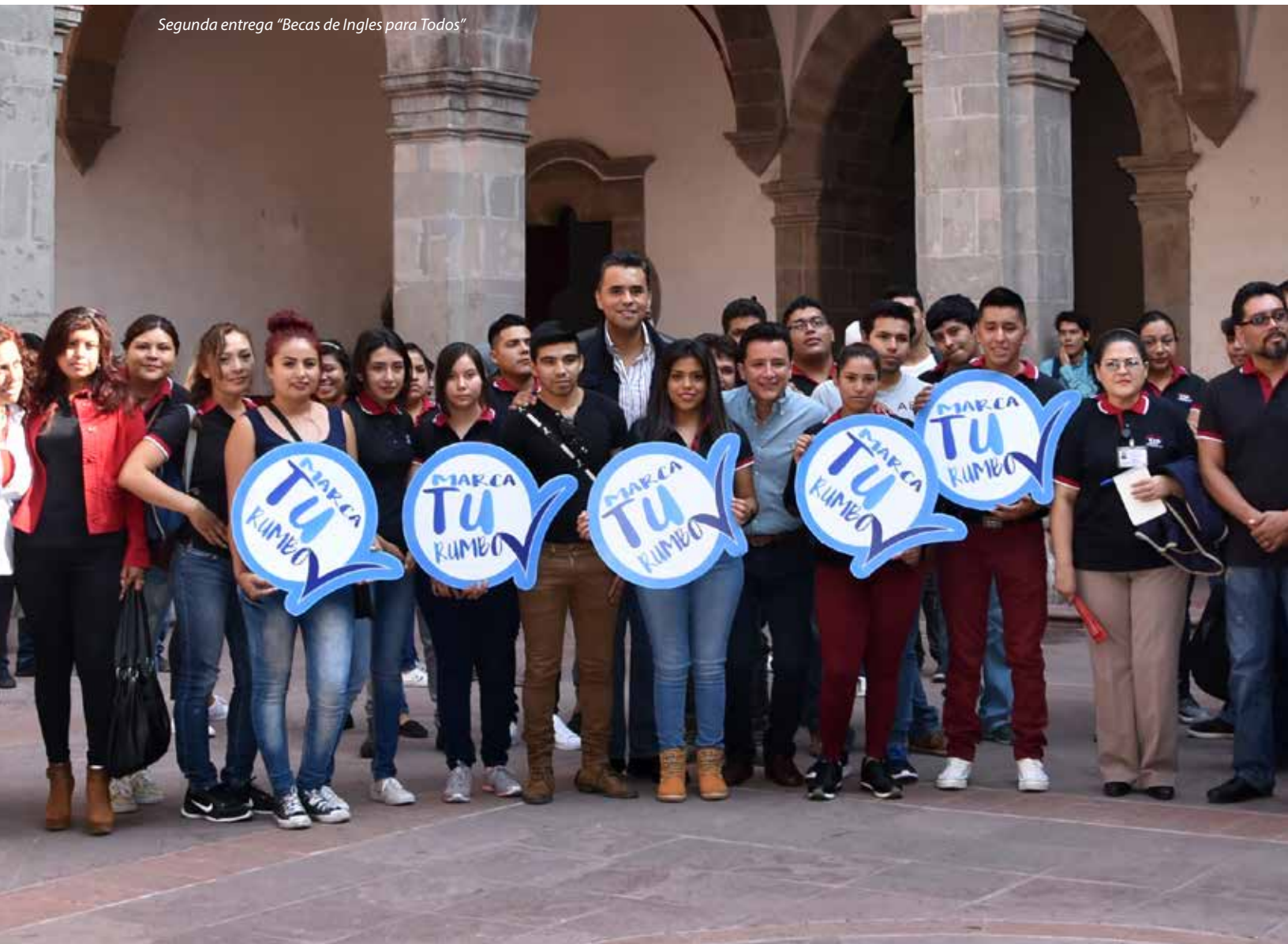
Segunda entrega "Becas de Ingles para Todos"