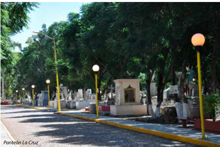
Panteón La Cruz