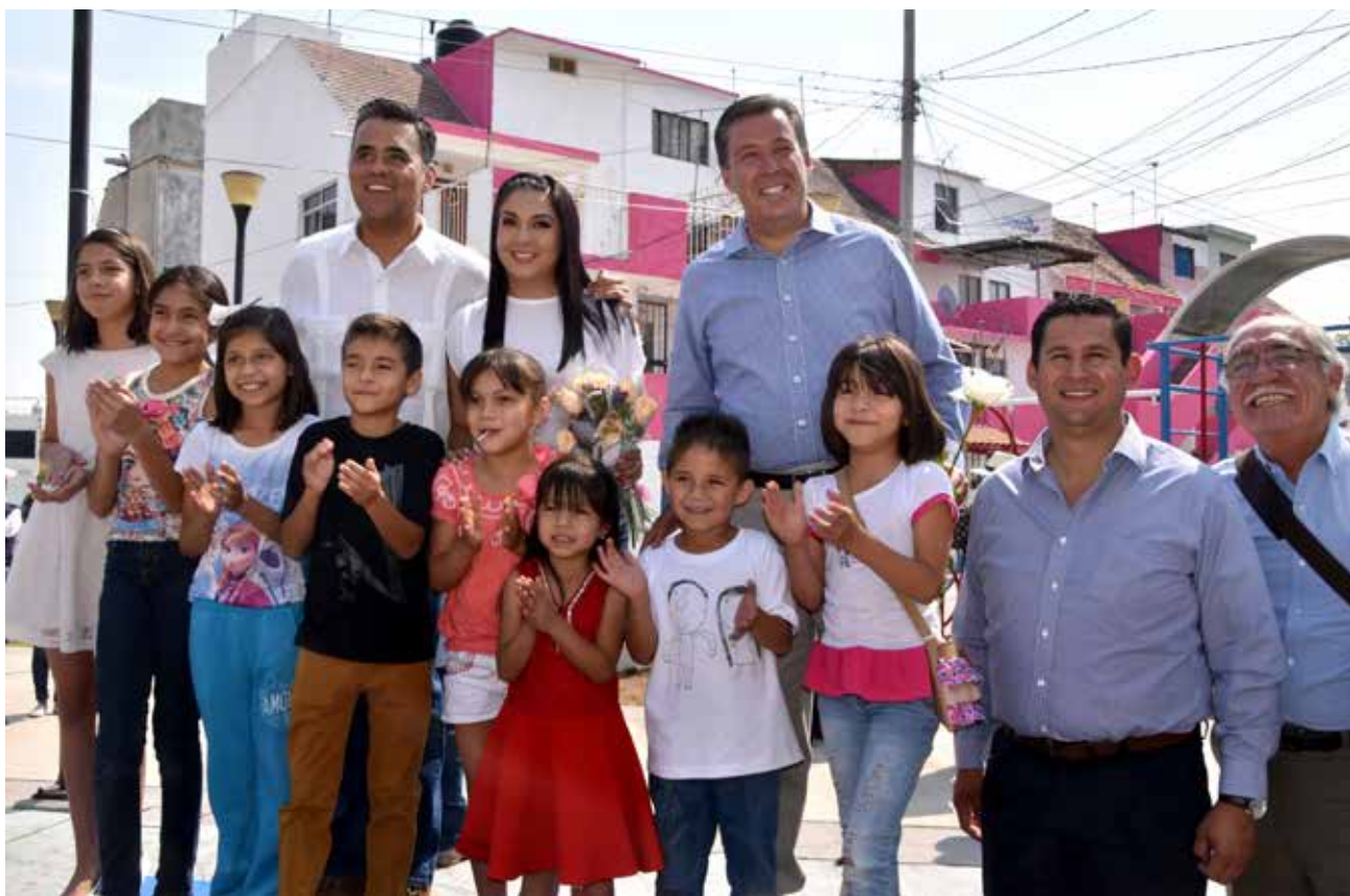
Arranque del Programa "Pinta tu Entorno", Col. Infonavit 1