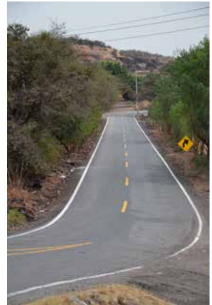
Camino a Com. de San José de Uluapan