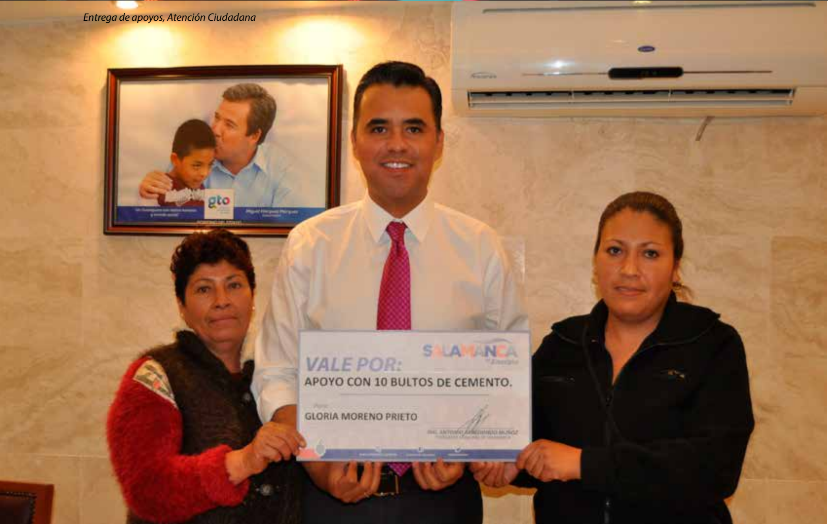
Entrega de apoyos, Atención Ciudadana