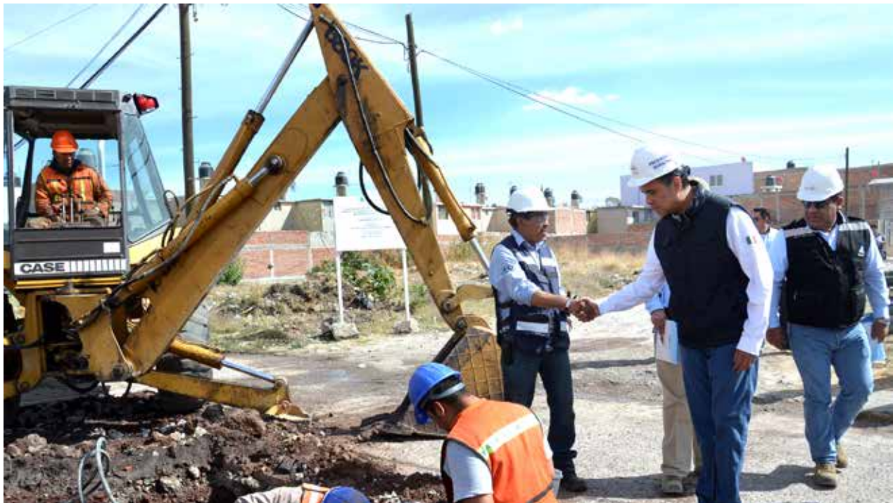
Supervisión de construcción del colector sanitario calle Del Bosque, Col. San Juan Chihuahua

Además, de las solicitudes de colonos, realizamos 604.43 metros en ampliación de redes de drenaje en diversas colonias, a través de un recurso de CMAPAS de 1 millón 178 mil 909 pesos.