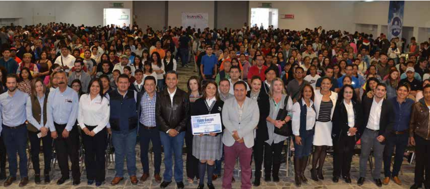
Primera entrega Programa de Becas de Inglés

En coordinación con el Instituto Mexicano de la Juventud y el Instituto de la Juventud Guanajuatense, apoyamos a 1,500 jóvenes el Programa de Becas de Inglés para Todos a través de la Universidad Cambridge (Etapas 1, 2 y 3). En este programa se realiza la entrega de las becas, posteriormente se realizan clases de inducción y se da el arranque formal de clases.