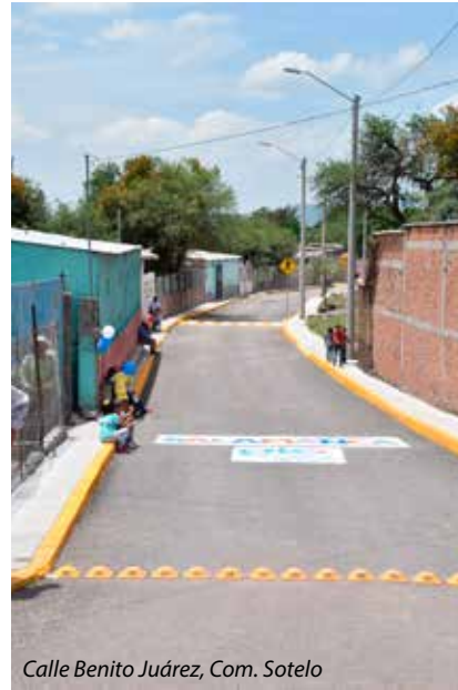
Calle Benito Juárez, Com. Sotelo