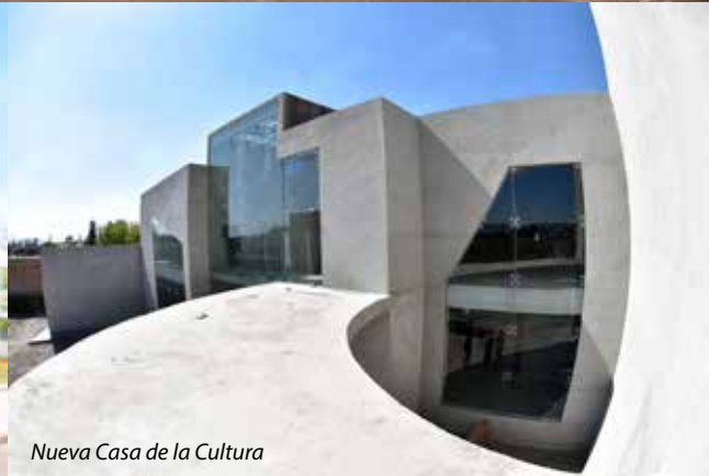
Nueva Casa de la Cultura