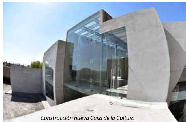
Construcción nueva Casa de la Cultura