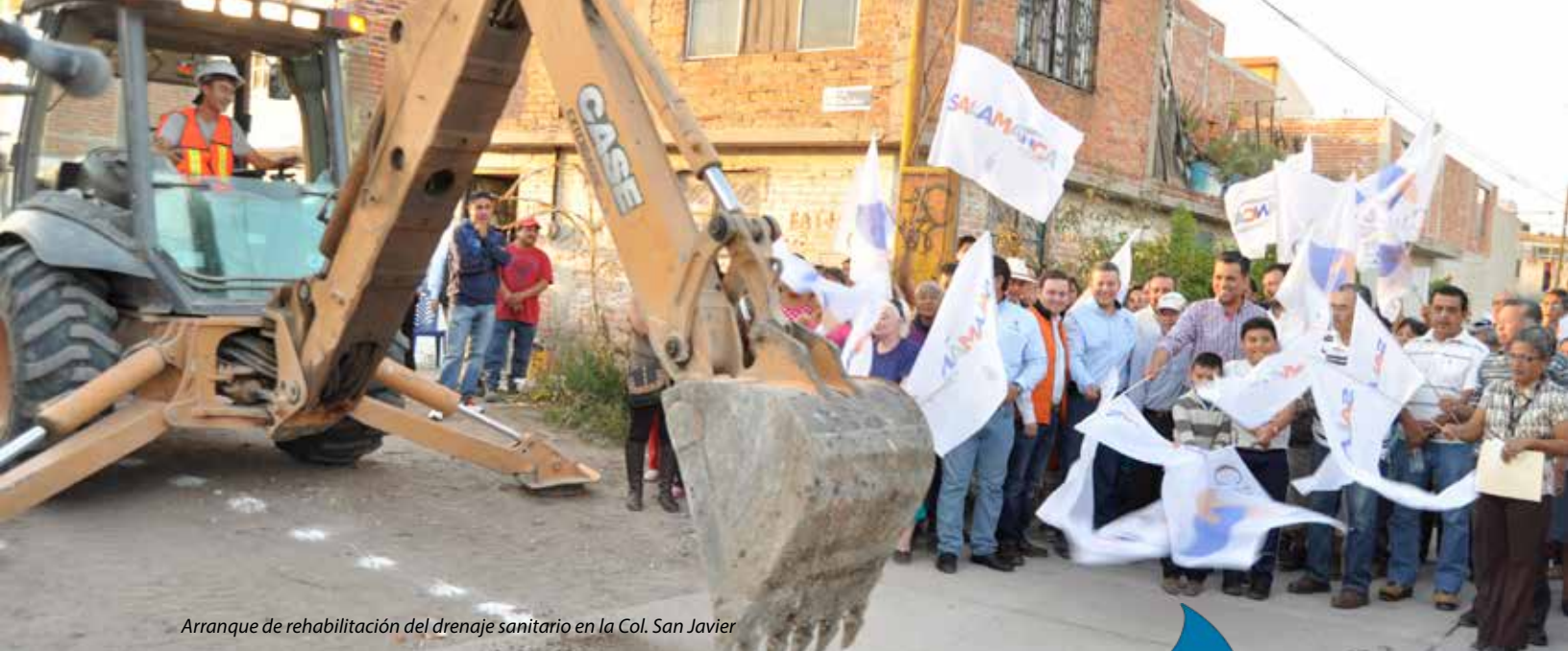
Arranque de rehabilitación del drenaje sanitario en la Col. San Javier