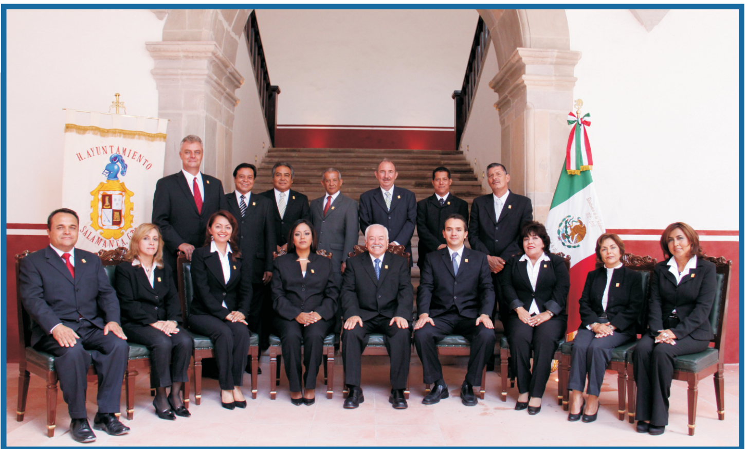
HONORABLE AYUNTAMIENTO DE SALAMANCA 2009 - 2012